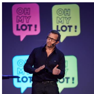
Fabien Galthié, ambassadeur et parrain Oh My Lot !

Près de 400 ambassadeurs, Lotois de toujours ou néo-Lotois, jeunes ou moins jeunes, revendiquent leur attachement au territoire. Avec enthousiasme, sincérité et authenticité, chacun à sa manière s'engage à promouvoir le territoire lotois. Cela passe par du partage d'expérience , de bons plans locaux ou par la participation aux événements dont nous sommes partenaires.