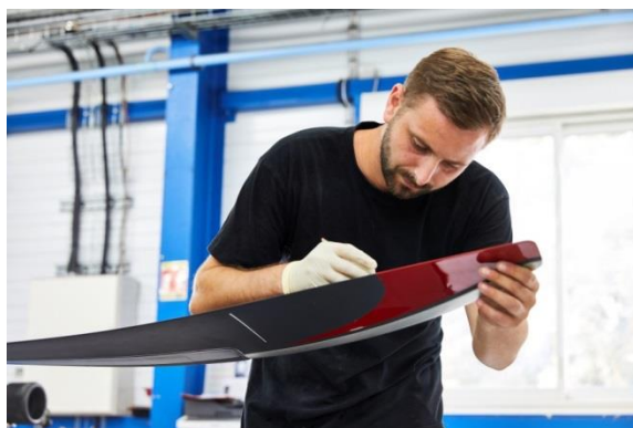
Entreprise Chassint (peinture industrielle) à Bédouer

De grandes entreprises telles qu' Andros, Valette ou encore G.Pivaudran sont régulièrement à la recherche de nouveaux collaborateurs. Nos collectivités territoriales sont également des recruteurs importants qui accueillent chaque année de nouveaux agents dans tous les secteurs. Le tissu économique est aussi marqué par un maillage très dense de PME dans de nombreux secteurs d'activité. Agro-alimentaire, aéronautique, industriels de pointe composent le paysage économique lotois.