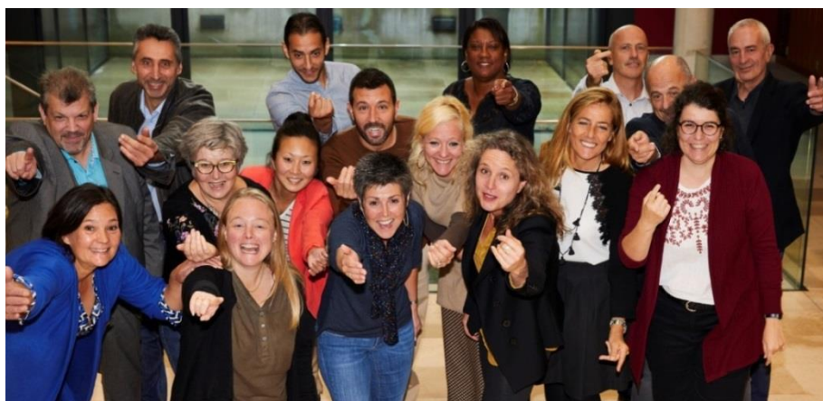
Réunion des référénts accueil du 15 octobre 2019

Oh My Lot ! c'est avant tout le travail collectif d'un réseau de référénts accueil en capacité de proposer un accompagnement des personnes intéressées par une mobilité dans le Lot.